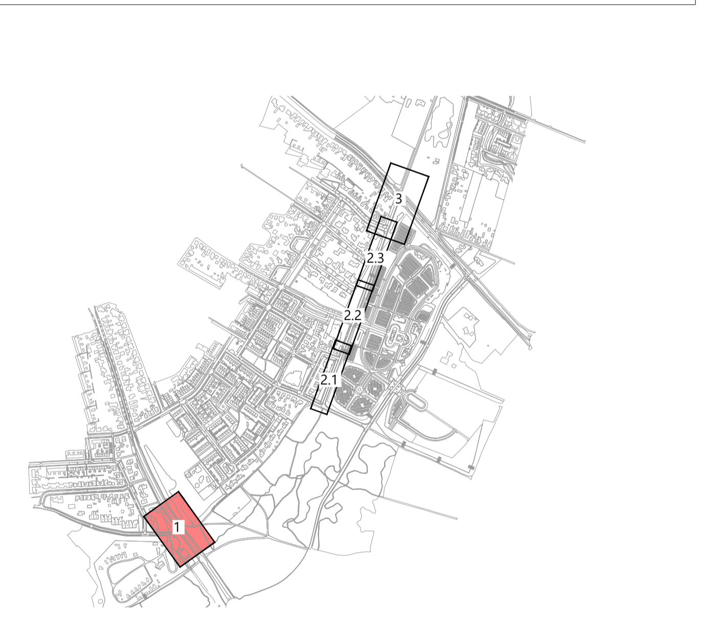
OVERZICHT Schaal 1:10.000